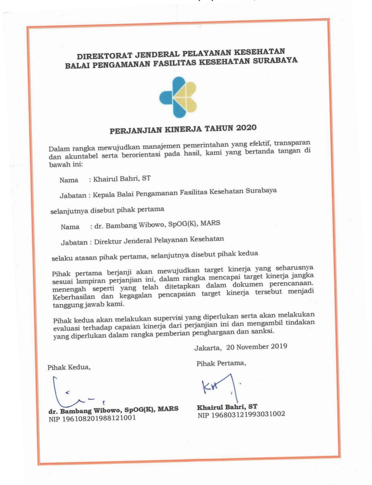
Tabel 2. Perjanjian Kinerja

Direktur Jenderal Pelayanan Kesehatan Kementerian Kesehatan RI tertuang dalam Perjanjian Kinerja Tahun 2020.